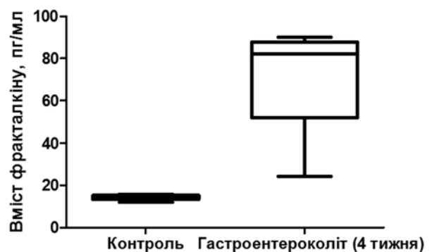
Рис. 2. Вміст фракталкіну у сироватці крові щурів з гастроентероколітом, що викликаний чотирьохтижневим вживанням карагенану

Краще розуміння імунологічних процесів, що регулюються цитокинами та хемокинами, зокрема фракталкіном, необхідно для розробки нових терапевтичних підходів до лікування хронічних запальних захворювань шлунково-кишкового тракту. Використання інгібіторів фракталкіну може бути обґрунтоване для зниження інтенсивності запального процесу та перешкоджання переходу гострого інтестинального запалення у хронічну форму за рахунок зниження хемотаксису клітин імунної системи та інгібування міграції фібробластів.